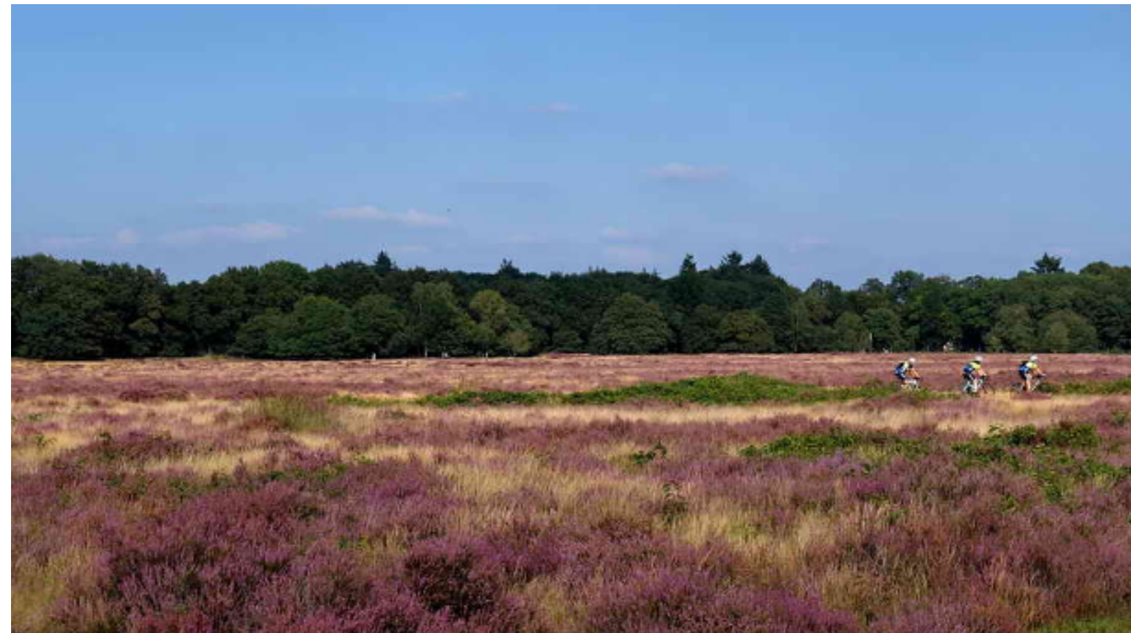
Natuurreserveat De Ginkelse Heide